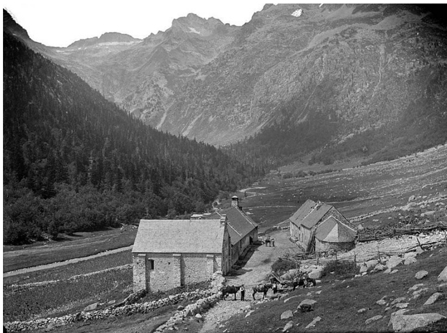
Espitau des Pontelhs en 1907.

Aquerò que coneishem aué der Espitau des Pontelhs deth sègle XVI ac deuem en gran part a Ferran Valls Taberner e ar excursionista e gran