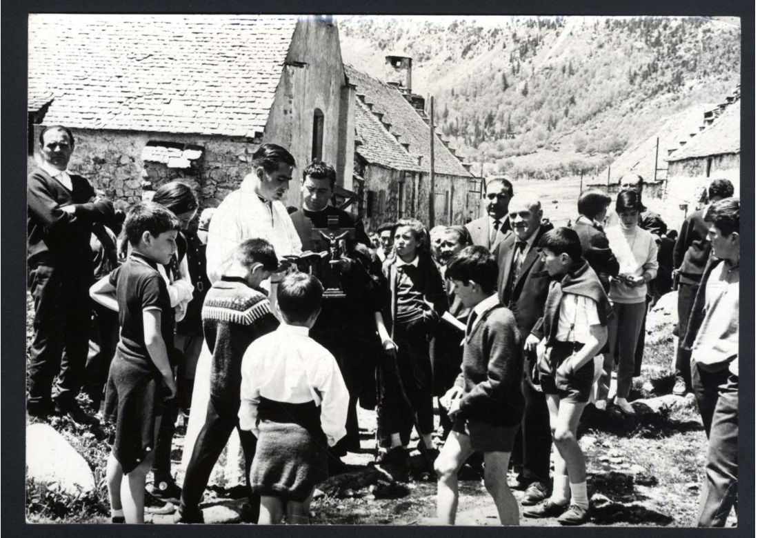
Hònt: Archiu Generau d'Aran. Colleccion Mn. Xavier Esplandiu Xuclà, 5.

En Espitau des Pontelhs tostemp, o des deth sègle XVI qu'auem documents qu'ac documenten, n'i auie individús entà recéber es caminaires e un o dus caperans, membres dera comunautat eclesiastica dera parròquia de Vielha.